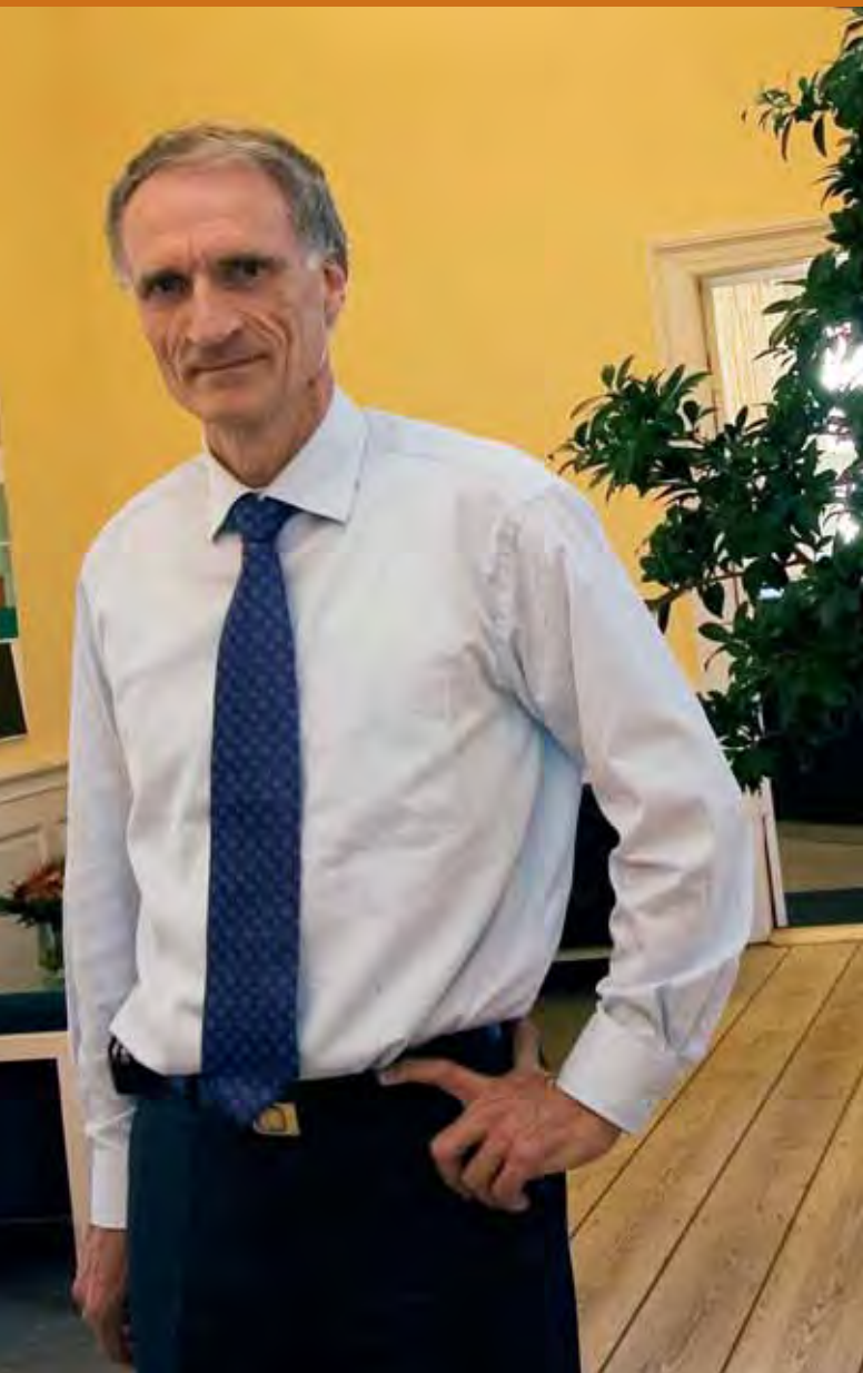
Undervisningsminister Bertel Haarder