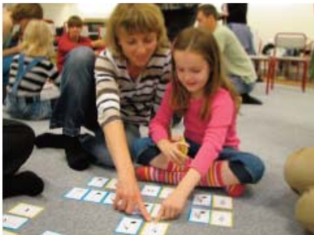
Kursist hjælper elev med spillet "Tokyo Draw"