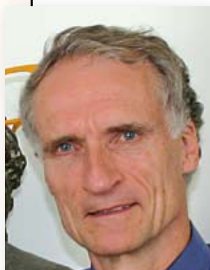
... af undervisningsminister Bertel Haarder

“Når vi synger sammen med andre, er vi ikke os selv nok. Vi overskrider os selv og bliver en del af noget større. Når det lykkes, kan det høres!”