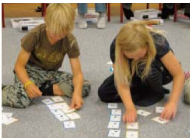
Elever fra Klostermarksskolen spiller "Fine"